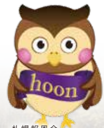
札幌報恩会 マスコットキャラクター 報和くん